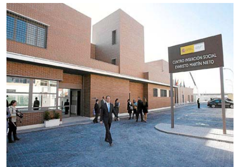
Centro de Inserción Evaristo Martín Nieto.

de trabajo es sencillamente inasumible para una plantilla de 60 trabajadores (funcionarios de interior, oficinas, personal laboral, servicios sociales...). Esta situación crítica se acentuará cuando se nombren funcionarios de carrera a los cinco funcionarios que actualmente están haciendo prácticas en el establecimiento, disminuyéndose la plantilla actual. Una solución sería abrir el Centro Penitenciario en Archidona, Fuentes fiables, nos indican que no se va a proceder a su apertura, con lo que la situación actual va a perdurar en el tiempo. Esta noticia se ha publicado en diario Sur , el Mundo , 20 Minutos , Málaga Hoy , Diario Qué .