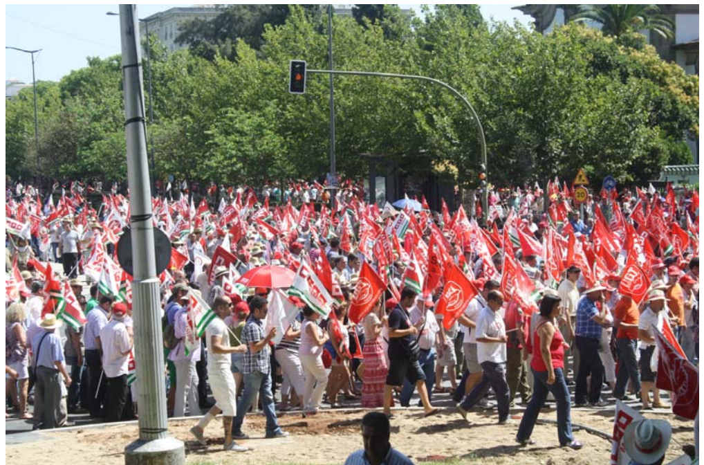
Una de las manifestaciones celebradas como protesta por recortes, en la que una marea de banderas rojas inunda las calles.

Desde UGT Málaga valora positivamente la firma del II Acuerdo para el Empleo y la Negociación Colectiva 2012, 2013 y 2014, después de cuatro meses de negociaciones y jornadas maratónicas para que los máximos responsables de la patronal CEOE y de los sindicatos estamparon finalmente el pasado 25 de enero sus firmas en el citado acuerdo, un pacto, que viene a establecer las directrices en materia salarial para los próximos tres años. Este acuerdo ha recibido el apoyo de UGT, central sindical que ha manifestado sentirse "satisfecha" no sólo por haber logrado adaptarse a la difícil situación económica que atraviesa España, sino también por convertirse en un acuerdo de «reivindicación» del papel de los agentes sociales. UGT confía en que el pacto sobre salarios y convenios evite una reforma laboral que ve innecesaria, aunque desde el Gobierno se mantenga la intención de sacarla adelante en las próximas semanas. El acuerdo establece que los convenios sectoriales deberán propiciar la negociación en la empresa, que es necesario preservar el ámbito provincial de negociación y favorecer que tales convenios, potencien