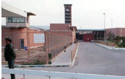
Un lateral de la fachada de la prisión de Alhaurín de la Torre.