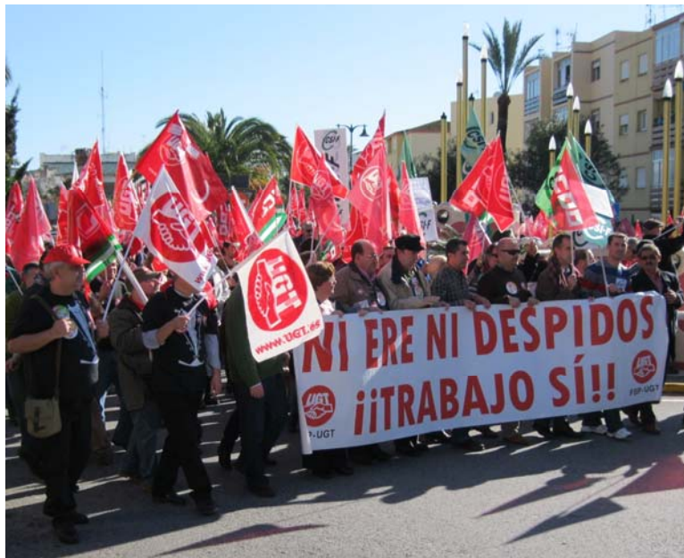
Asistentes a la manifestación en contra de los despidos de empleados municipales en Los Barrios.