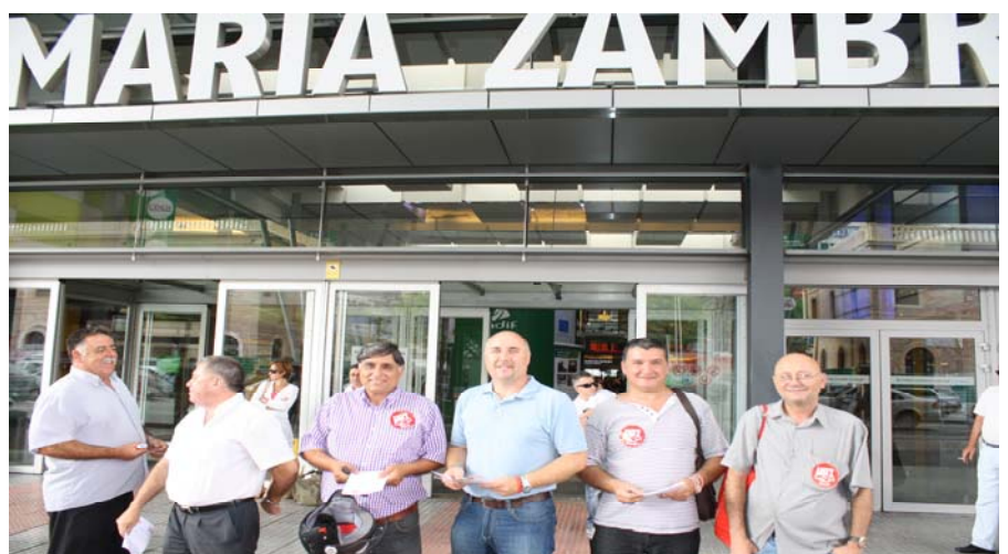
Reparto de octavillas en la estación María Zambrano.