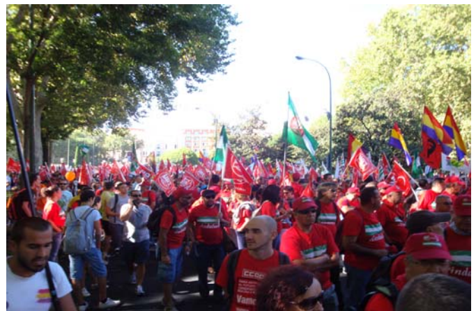
Banderas ugetistas se pudieron ver por todo el recorrido de la protesta.