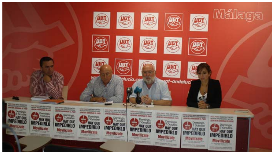
Rueda de prensa en la que se hizo la denuncia de la ruptura del pacto por el empleo.