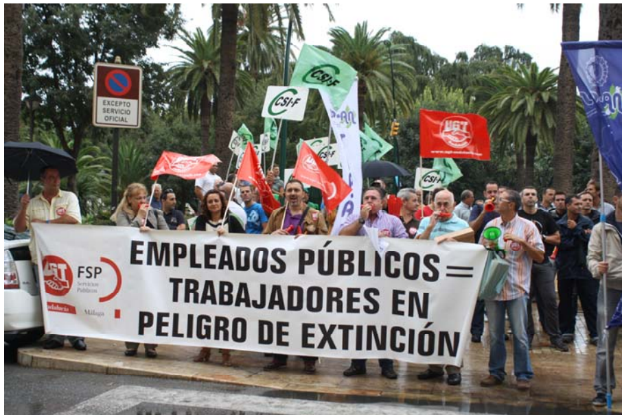
Centenares de trabajadores concentrados en contra del plan de ajuste del Ayuntamiento.

Centenares de trabajadores se concentraron el pasado 27 de septiembre a las puertas del Ayuntamiento de Málaga por el plan de ajuste presentado por el alcalde de Málaga, Francisco de la Torre. La Federación de Servicios Públicos (FSP) de UGT Málaga denunció que "llevamos desde hace más de cinco años arrastrando un déficit de unos 1.000 puestos de trabajo en este Consistorio, lo que quiere decir que al contrario que en otros municipios que se han dedicado a sobredimensionar sus plantillas, hecho que ha provocado su déficit, en el de Málaga hemos tenido menos plantilla para realizar el mismo trabajo". La FSP- UGT Málaga indicó que los sueldos de los trabajadores del Ayuntamiento de Málaga son "uno de los más bajos de la provincia". Además, "ha sido un plan de ajuste sin consenso y sin presentárnoslo a los sindicatos y sin saber cómo va afectar el plan al resto de Capítulos que componen el presupuesto del Ayuntamiento, hecho que creemos imprescindible". Dicha federación señala que "estas medidas del plan de ajuste vienen a acrecentar la pérdida de poder adquisitivo de los trabajadores del Ayuntamiento de Málaga, que en los dos últimos años ha sido del 20%, a lo que hay que añadir la subida del IVA, IRPF, etc. Por último la Federación de Servicios Públicos de UGT Málaga indicó que "son medidas que junto con