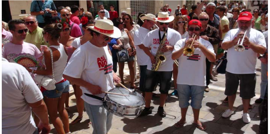
Una charanga recorrió las calles del centro en Feria con camisetas reivindicativas donde se

Todos estos actos tenían un objetivo claro: seguir luchando y protestando por los recortes y conseguir que la manifestación de Madrid del pasado 15 de septiembre fuese todo un éxito. Así, el pasado 11 de septiembre más de 50 organizaciones se sumaron a la protesta. Esta marcha estaba encaminada a que los trabajadores y trabajadoras malagueños no seamos víctimas de un Gobierno que abusa de su poder para castigar a los más débiles y favorecer a los más ricos.