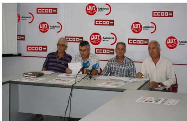
Rueda de prensa para informar de la concentración del próximo lunes 8 de octubre por el crecimiento del empleo en la industria.

CONCENTRACIÓN EN MÁLAGA A LAS 19:00 H. ANTE LA DELEGACIÓN DE HACIENDA.