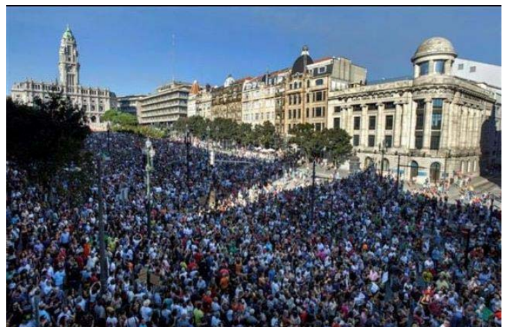
Centenares de miles de personas en Madrid reivindicando un referéndum para cambiar las políticas antisociales del Gobierno del PP.

De Málaga una veintena de autobuses partieron la noche del viernes para llegar a Madrid el 15-S y para seguir reivindicando un cambio en las políticas del Gobierno. Los manifestantes estuvieron por la Plaza de Colón y varias calles de la ciudad. Durante la protesta se pudieron observar muchas banderas republicanas, numerosas pancartas de diversos colectivos, en definitiva, españoles de todos los puntos del país que se acercaron a la capital de España en una jornada reivindicativa de gran intensidad y calado.