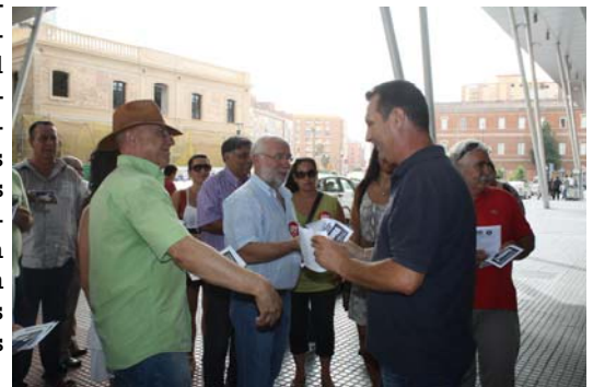
Reparto en octavillas en la estación Vialia María Zambrano el pasado 2 de agosto.

respetar la ley y sin aumentar la plantilla. "La caída del consumo unida a la subida del IVA va a empobrecer aún más el mercado de trabajo". El jueves día 2 de agosto ya se repartieron miles de octavillas informando de los perjuicios de los recortes.