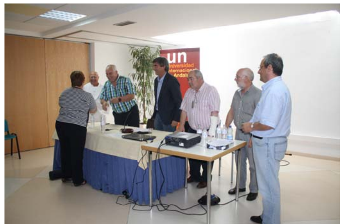
Entrega de diplomas a los alumnos.