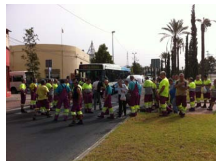
Asamblea informativa celebrada días antes de la huelga en el Taller Los Prados.

público y el Gobierno para hacer viable su política de privatización de las empresas como Renfe, pretende hacernos ver que lo privado es mejor que lo público, que nos costará más barato los billetes y darán más servicios”, algo que la federación desmintió rotundamente. Baja el lema ‘Luchemos todos por nuestro ferrocarril’, la huelga tuvo un éxito masivo.