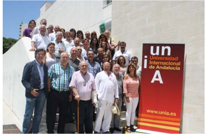
Clausura del curso el pasado 4 de julio.