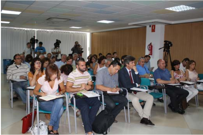
Alumnos del curso Sindicalismo de clase a inicios del siglo XXI.