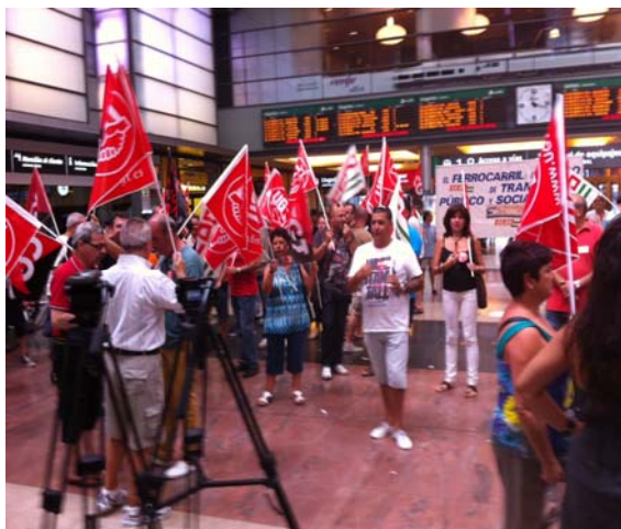
Concentración el día 3 en la estación Vialia María Zambrano.

La Federación de Transportes, Comunicaciones y Mar de UGT Málaga informó que el 100% de los trabajadores secundó la huelga en RENFE el pasado 3 de agosto cuya reivindicación más importante era que el Gobierno quiere “pretende regalar a empresas privadas” en vez de potenciar “nuestro ferrocarril mejorando la prestación del servicio y facilitando el acceso a un ferrocarril de calidad y que todos los ciudadanos y ciudadanas sabemos que tenemos uno de los mejores ferrocarriles de la Unión Europea”. La idea de privatizarlo llevó a UGT y CCOO a convocar una huelga que ha sido todo un éxito. En los días previos se celebraron asambleas en Ronda y Bobadilla, en Servicios Logísticos y Autopropulsados, en el taller del AVE y en el taller de Los Prados. Desde la Federación de Transportes, Comunicaciones y Mar indicaron que los servicios mínimos fueron abusivos, ni más ni menos que del 80%. “Consideramos que son los servicios mínimos más abusivos de la historia de la relaciones laborales en el sector