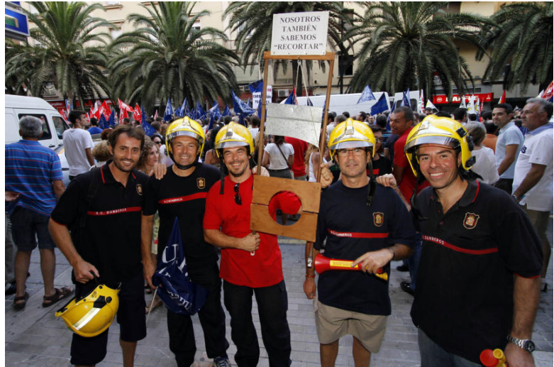
El Cuerpo de Bomberos también se movilizó con una pancarta en la que ponía 'Nosotros también sabemos recortar'

El sindicato convocante fue CSIF que "en ningún momento se puso en contacto con nosotros para organizar una sola manifestación", indicó a los medios de comunicación el secretario general de UGT Málaga. El líder sindical denunció que la CSIF "sólo quiere hacerle el juego al Partido Popular" y criticó a la Subdelegación del Gobierno por dar permiso a su protesta «que ha sido pedida con un sólo un día de antelación», mientras que por ley se exige que la petición se haga con diez días naturales como mínimo y treinta como máximo, aclaró.