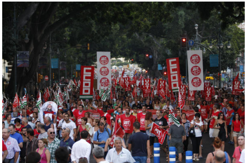
Una de las imágenes en las que se podía ver que no cabía un alfiler en la calle.