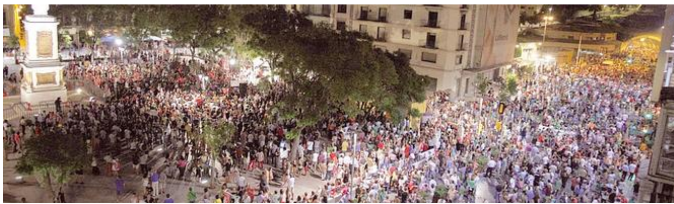
Una imagen de la abarrotada Plaza de la Merced el pasado 19 de julio, en la que se observa que la cola de la manifestación todavía iba al inicio del túnel.

Las calles malagueñas fueron tomadas el 19J por la ciudadanía. Trabajadores, parados, bomberos, policías, médicos, pensionistas, familias enteras en una manifestación convocada por UGT y Comisiones Obreras en la que se puso en evidencia la indignación de más de 100.000 malagueños y malagueñas que expresaron su rechazo a las políticas que está llevando a cabo el Gobierno de Rajoy, unas políticas dirigidas única y exclusivamente por recortes a todos los que no han creado la crisis, y que no iban en el programa electoral del Partido Popular.