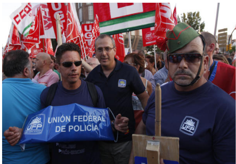
La Unión Federal de Policía también se adhirió a la manifestación en contra de los recortes.