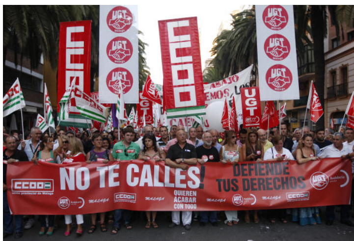
La cabecera de la manifestación con la pancarta en la que se podía leer 'No te calles, Defiende tus derechos'.

Fueron innumerables los colectivos que se sumaron a la misma. Entre ellos, la Plataforma en Defensa del Estado del Bienestar y los Servicios Públicos, que la componen diferentes asociaciones, partidos políticos, federaciones de vecinos, sindicatos de estudiantes, entre otros muchos.