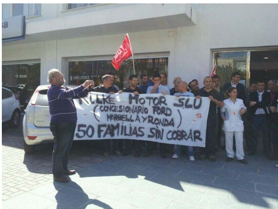
Una de las pancartas que pone Ford en la calle a 50 familias al presentar la empresa un Expediente de Regulación de Empleo que afecta a 42 trabajadores.