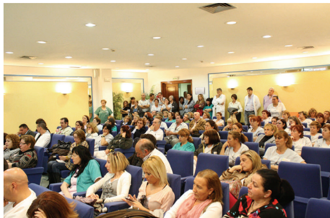
Asamblea informativa en el Complejo Hospitalario Carlos Haya.