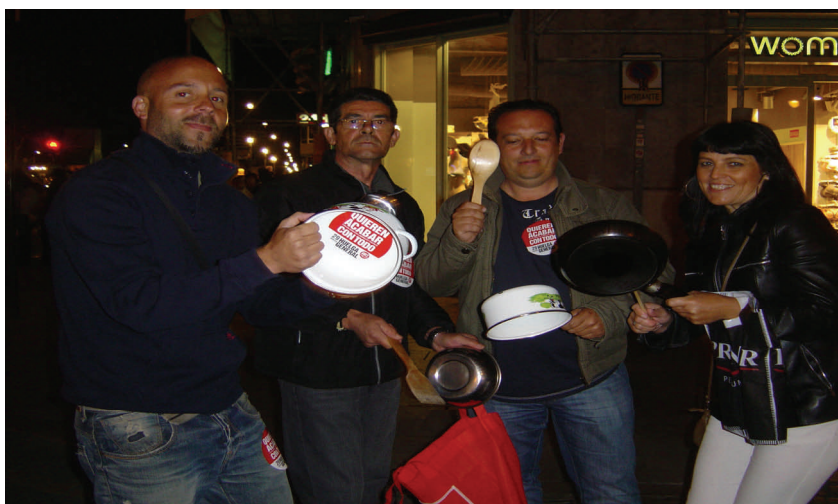
Compañeros/as que participaron el día 22 de marzo en la cacerolada organizada por la Unión en calle Larios.