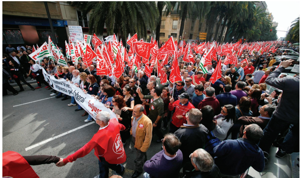
Miles de malagueños y malagueñas vuelven a decir en la calle No a la reforma laboral aprobada por el Gobierno del Partido Popular.

Sobre las 11.00 de la mañana ya empezó a agolparse una gran multitud de ciudadanos, aunque no fue hasta bien avanzado el mediodía cuando comenzó