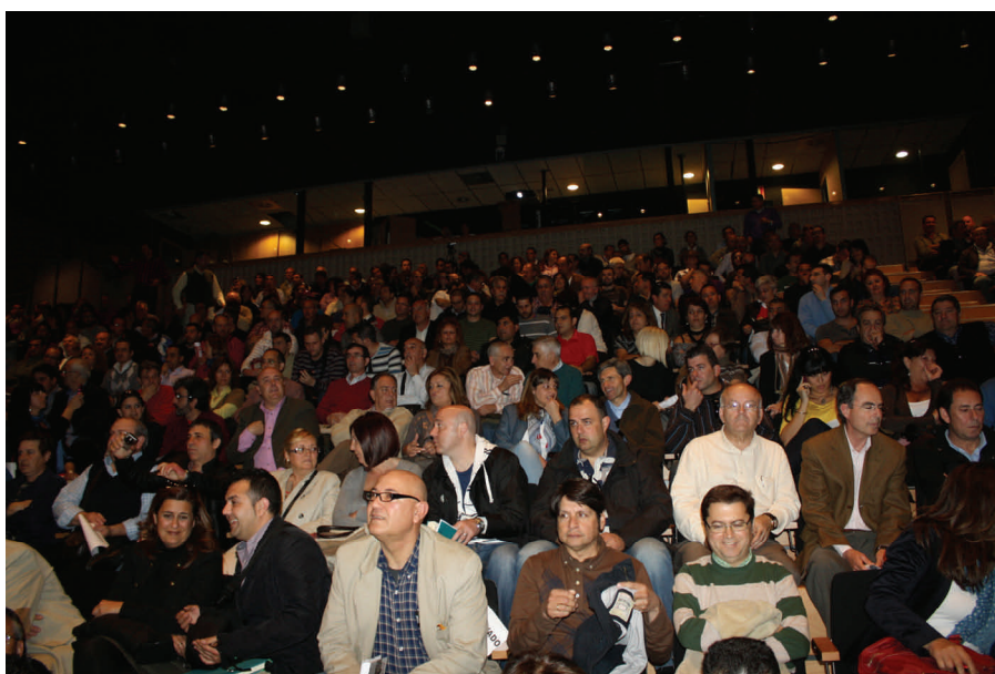
Asistentes a la asamblea celebrada en el salón de actos de la Diputación Provincial de Málaga.

El acto culminó con la intervención del secretario de Acción Sindical de UGT, Toni Ferrer, quien ha dejado bien claro que la huelga general "es necesaria y está cargada de razones". "Esta reforma laboral es autoritaria, clasista, de corte conservador", ha agregado. "Es la reforma de los despidos". La asamblea informativa terminó con la interpretación de la Internacional y el llamamiento a la ciudadanía para que secunden la huelga general del 29 de marzo. Por último, los asistentes escucharon la Internacional.