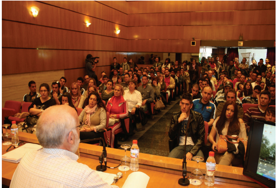
Asamblea celebrada en el Instituto de Estudios Portuarios con trabajadores y trabajadoras desempleados malagueños.

Por otro lado las federaciones y sindicatos provinciales que componen la Unión han celebrado más de 150 asambleas por toda la provincia, en el tejido empresarial malagueño, donde se ha expuesto las consecuencias de la reforma laboral, los motivos de la huelga y el porqué de secundarla.