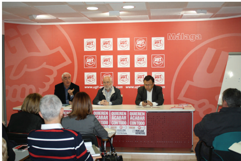
El PSOE de Málaga presenta su programa electoral al Consejo Provincial de UGT de cara a las elecciones autonómicas.

Por su parte, el Gobierno de Rajoy esperó a que pasaran las elecciones autonómicas celebradas en Andalucía para presentar los Presupuestos Generales del Estado, concretamente los presentó el 30 de marzo con el objetivo de que no saliesen a la luz antes de las elecciones autonómicas. Unos presupuestos que para Ferrer “suponen sólo recortes sociales en materias fundamentales”. Además, posteriormente Rajoy a través de una nota de prensa ha presentado 10 mil millones de euros más de recortes en sanidad y educación, lo que puede llevarnos en breve al mal llamado copago sanitario puesto que sería repago, ya implantado en Cataluña.