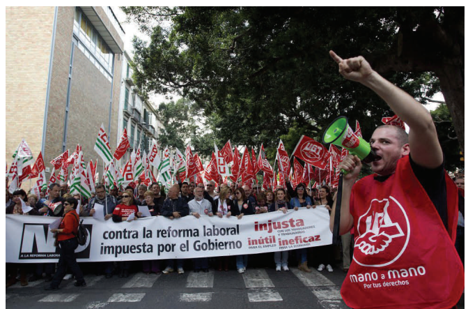
La cabecera de la pancarta con el lema 'No a la reforma laboral' por injusta, inútil e ineficaz.

UGT Málaga agradece la participación e implicación de numerosos malagueños y malagueñas durante la jornada de huelga, lo que ha supuesto que la misma resultara un tremendo éxito y que esta ciudad se paralizara durante un día. Objetivo que nos marcamos y que finalmente hemos conseguido.