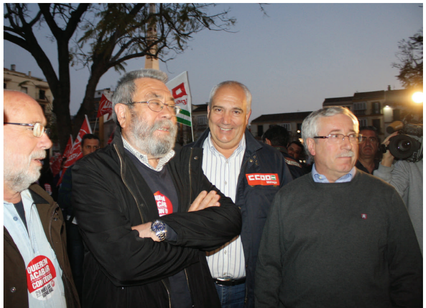
Méndez a su llegada a la céntrica plaza de la Merced, al lado del secretario general de UGT Málaga, Manuel Ferrer (a la izquierda) junto con su homólogo de Comisiones Obreras a nivel estatal, Ignacio Fernández Toxo y su homólogo en Andalucía, Francisco Carbonero, momentos antes de su intervención.