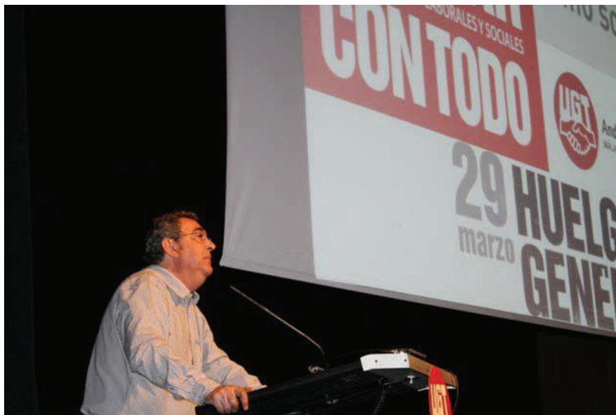
Intervención del secretario de Acción Sindical de UGT estatal, Toni Ferrer, en una asamblea en Málaga.

Más de 500 delegados y delegadas y responsables sindicales de los distintos sectores asistieron el 14 de marzo a la asamblea convocada por la UGT de Málaga para explicar los efectos de la reforma laboral aprobada por el Gobierno del Partido Popular y para hacer un llamamiento a la movilización de cara a la huelga general del 29-M. Al inicio de la asamblea se ha proyectado un vídeo elaborado por esta Unión Provincial donde se evidenciaba el cambio de actitud de Rajoy y su equipo cuando estaban en la oposición y ahora cuando ha entrado al Gobierno y se veía como antes decía una cosa y ahora hace completamente lo contrario. Durante la asamblea se han repartido trípticos elaborados por UGT Málaga con las razones contra la reforma laboral.