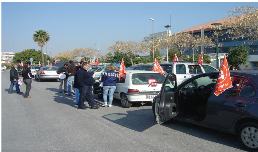
Caravana de coches organizada el martes 27 de marzo, con recorrido en polígonos industriales y centro de Málaga.

dejado claro que la reforma laboral "echa por tierra todos los avances conseguidos en esta materia". Alamán ha subrayado que este Real Decreto "supone un retroceso de derechos, aumentarán las desigualdades y precarizará aún más los contratos para las mujeres, contribuyendo al aumento del empobrecimiento y de las discriminaciones que todavía sufrimos". Asimismo desde esta Secretaría a través de los jóvenes de Surgente han repartido octavillas sobre todo en el ámbito universitario llegando a la juventud.