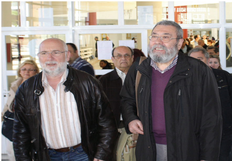
El secretario general de UGT, Cándido Méndez y su homólogo en Málaga, Manuel Ferrer, a la entrada de la asamblea de delegados celebrada en la facultad de Derecho.

"Esta reforma laboral va a incrementar la destrucción de empleo", ha asegurado el secretario general de UGT. "Si a finales de 2012 en España hay seis millones de trabajadores en paro, gran parte del aumento del desempleo, desde las cifras registradas hoy (se refería al pasado día 5) hasta esos 6 millones, será culpa de la reforma laboral". Méndez hizo alusión a las negociaciones que el Gobierno de Rajoy pretende hacer en Europa para conseguir que los límites impuestos al déficit público español sean flexibles. Según hizo público hace unos días el ministro Cristóbal Montoro el déficit actual es de un 8,5%, casi el doble de lo exigido por Bruselas para este año. "Lo lógico no es negociar para este año sino para el 2013, cuando los límites impuestos por la UE están en el 3%. ¿Cómo van a recortar en año y medio más de 55.000 millones? Se preguntó Méndez.