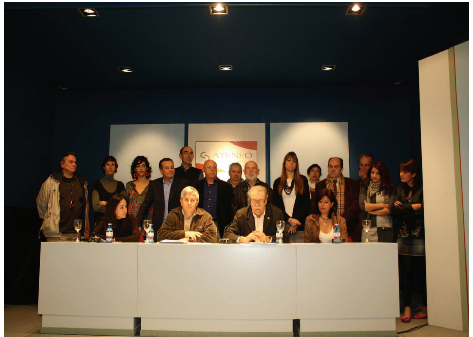
Plataforma en Defensa del Estado del Bienestar Social y los Servicios Públicos.

La plataforma está compuesta por: Facua Málaga, Sindicato de Estudiantes, IU, PSOE, Asociación en Defensa de la Sanidad Pública, Federación de Vecinos Unidad, Federación de Vecinos Solidaridad, Unión Federal de Policías, Sindicato Unificado de Policías, Amigos de Bolivia, Carisma Juvenil, Juventudes Socialistas, UPA, CEPES Andalucía, Asociación andaluza por la Solidaridad y la Paz, Asamblea de Cooperación por la Paz, entre otras. Durante el acto, Ferrer ha hecho un llamamiento a la ciudadanía malagueña para que acuda a la manifestación celebrada el pasado día 29, a partir de las 20.00 horas, que partió de Alameda de Colón y culminó en la plaza de la Constitución con la intervención de Ferrer y la interpretación de la Internacional socialista.