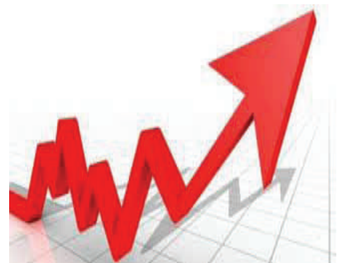
El IPC aumenta un 0,2% en Málaga en febrero y la tasa interanual se sitúa en el 2%.

El secretario general de UGT Málaga criticó "la pérdida de poder adquisitivo de los trabajadores y trabajadoras por la congelación que ha hecho el Gobierno del PP del Salario Mínimo Interprofesional (SMI).