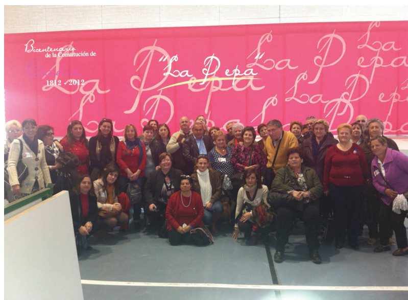
Mujeres malagueñas que asistieron al acto regional del Día de la Mujer celebrado en Cádiz.

Tres autobuses con numerosas delegadas malagueñas participaron el pasado día 8 de marzo en el acto regional convocado por UGT Andalucía con motivo del Día Internacional de la Mujer y que este año tocó celebrarlo en la provincia de Cádiz. El acto contó con la asistencia de representantes sindicales de las federaciones provinciales y delegadas ugetistas para reivindicar la presencia de más mujeres en puestos directivos y altos cargos y criticar que con la reforma laboral se pierda cada vez más la posibilidad de conciliar la vida familiar y laboral, un punto que las mujeres venimos exigiendo año tras año.