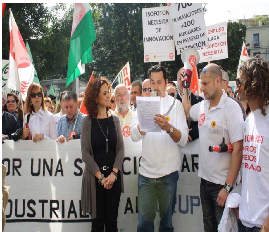
Una de las concentraciones de Isofotón frente a la Delegación del Gobierno de la Junta.