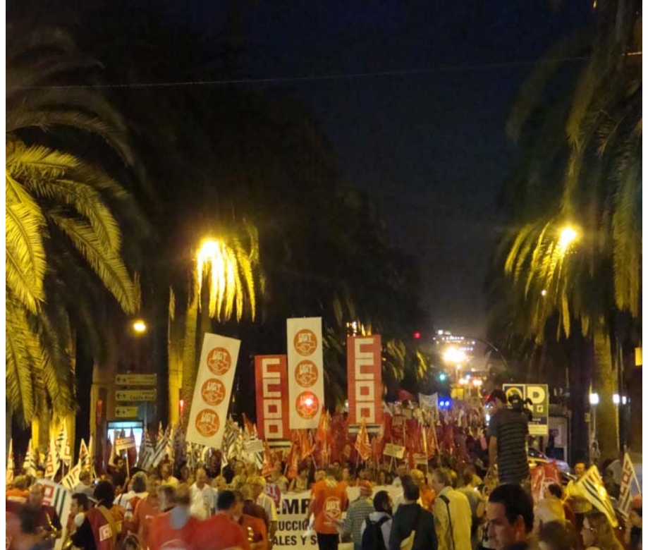
La Alameda de Colón llena de gente durante la manifestación del pasado 7 de octubre.

A nivel regional más de 700 convenios se encuentran bloqueados o sin haber sido negociados (en Málaga cerca de 40 que afecta a casi 6.000 trabajadores están bloqueados y los que están pendientes de negociarse afecta a 74.934 trabajadores). Ferrer indicó que en relación a la reforma impuesta de la negociación colectiva, ésta supone: debilitar el convenio colectivo y las relaciones laborales colectivas, individualizar dichas relaciones, imponer peores condiciones laborales y salariales, trabajar con menos derechos, facilitar aún más el despido y restringir la participación de los trabajadores en la empresa, entre otros aspectos. "Esta en peligro el Estado del Bienestar" denunció Ferrer y con ello la sanidad al plantearse el copago como solución para financiar las prestaciones sanita-