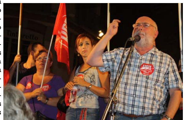
Ferrer en un momento de su intervención en la plaza de la Constitución.

promiso de los gobiernos, bancos y grandes empresas en la generación de empleo, garantizar la protección económica, rectificar la reforma laboral, terminar con el fraude empresarial en la contratación, rectificar la reforma de la negociación colectiva, un sistema educativo de calidad, público, universal y gratuito, entre otros puntos.