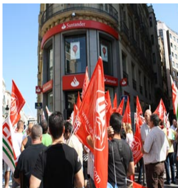
Protesta en las entidades bancarias para que faciliten la apertura de líneas de créditos a las familias, pymes y autónomos.