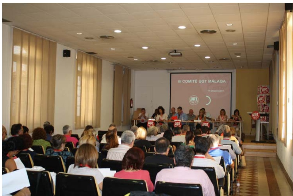
III Comité Provincial de UGT Málaga celebrado el pasado 14 de octubre en el Centro Cívico.

Un proyecto único en toda Andalucía que está destinado a trabajadores inmigrantes mayores de 25 años desempleados e inscritos como demandantes de empleo en la provincia de Málaga. También mencionó los servicios que prestan UGT a las distintas federaciones como la mediación en el SERCLA, el apoyo en negociación colectiva y en prevención de riesgos laborales. También se presentaron los presupuestos para el año próximo, que fueron votados por unanimidad.