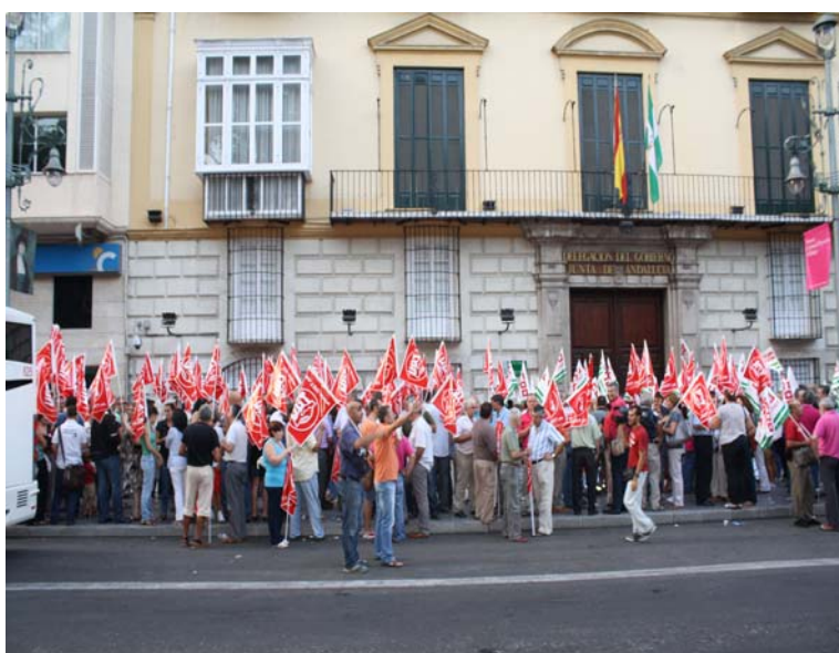
Concentración en la Delegación del Gobierno de la Junta de Andalucía en Málaga.