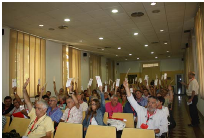
La gran mayoría de los miembros del comité votaron a favor de la gestión de la Comisión Ejecutiva Provincial.