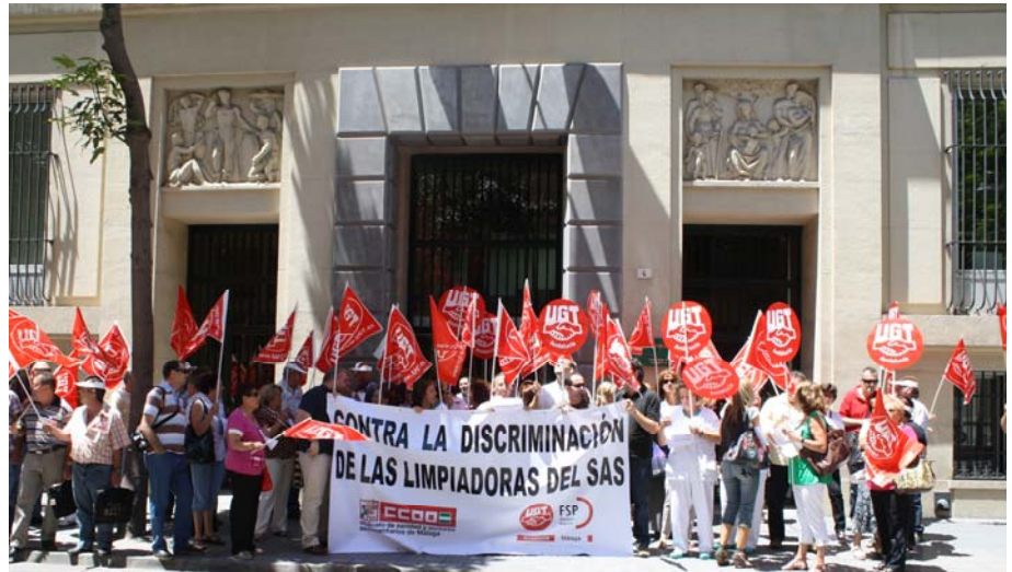
Trabajadores de UGT y en la concentración contra la discriminación a las limpiadoras en la puerta de la Delegación Provincial de Salud, en calle Córdoba.

euros”. Contioso señaló que “la política de ocultación de datos del SAS a los representantes de los trabajadores hace difícil ver los datos de consecución de objetivos de forma personalizada y hace difícil la cuantificación exacta de los euros dejados de percibir por este colectivo”.