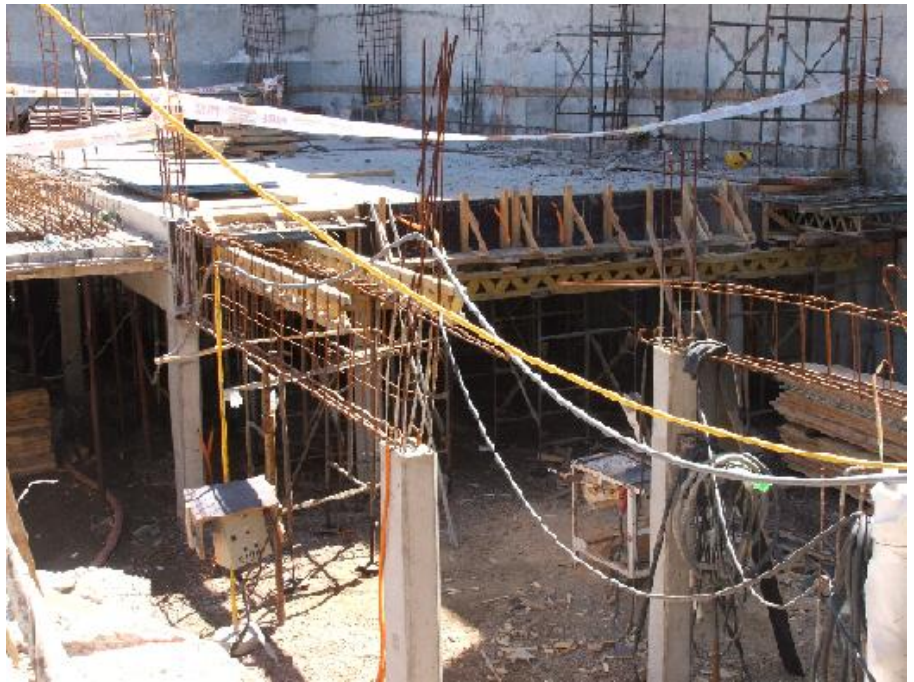
UGT alerta que ha aumentado la siniestralidad y aboga por la cultura preventiva.

ción de Trabajo ha realizado en este periodo 5.070 actuaciones frente a las 5.265 del primer trimestre de 2010. En cuanto a infracciones detectadas en el sector Servicios en el primer trimestre de 2011 ascienden a 75, de las que 17 fueron motivadas por la ausencia de formación e información a los trabajadores en materia de prevención, 15 han sido debidas por anomalías en las actuaciones de los servicios de prevención ajenos y 13 por falta de coordinación de actividades empresariales en dicho sector. Se han registrado también 22 infracciones en el sector de la Construcción, cinco en Industria y otras cinco en Agricultura y Pesca. Respecto a los 1.226 requerimientos realizados por la Inspección de Trabajo, la mayoría también son del sector Servicios 623, seguido de Construcción con 468, 128 en Industria y siete en Agricultura y Pesca. Sin embargo en el primer trimestre de 2010 se realizaron menos requerimientos, en concreto y fue Construcción la que acaparó la mayoría con 609, seguida de Servicios con 421, 73 en Industria y cuatro en Agricultura y Pesca. Jiménez señaló que desde UGT Málaga "seguimos