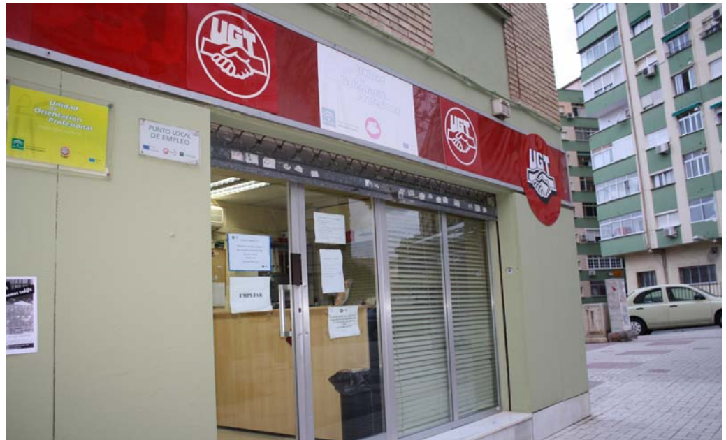
Unidad del Programa Andalucía Orienta en Málaga capital, en calle Rosa, que lleva funcionando desde el año 2005 y depende de la Consejería de Empleo de la Junta.