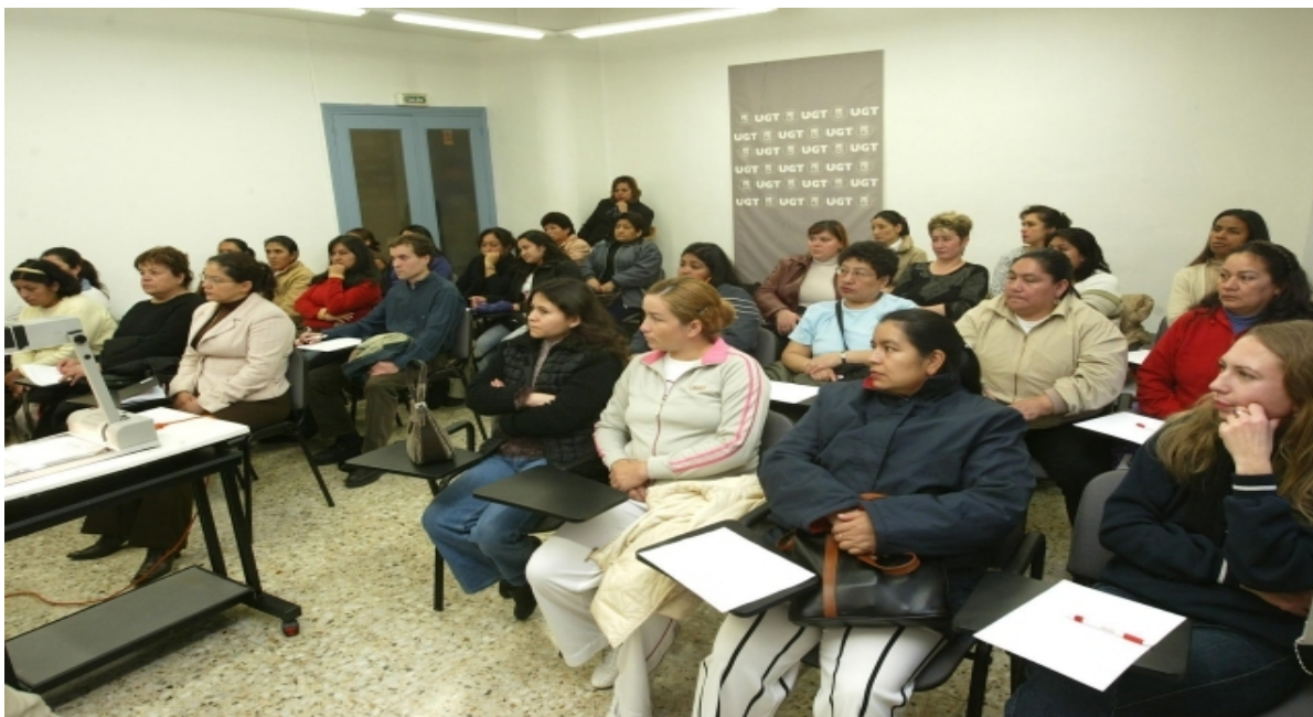
Inmigrantes empleadas en el servicio doméstico en una charla de UGT, organización sindical que apuesta por favorecer el acceso al empleo en condiciones dignas de este colectivo.