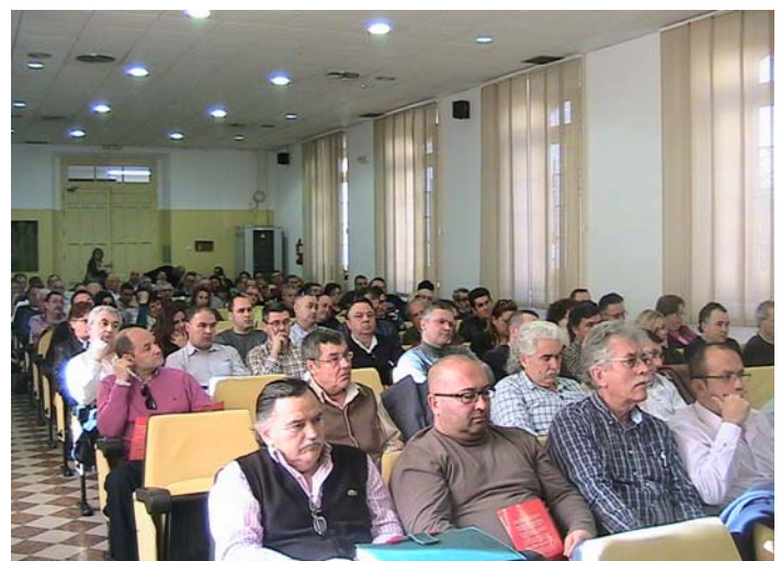
Asistentes a la asamblea informativa sobre el Acuerdo Económico y Social.

bilación parcial y cualquier posibilidad de jubilación anticipada. El Gobierno ha retrocedido y ha incorporado medidas propuestas por UGT.