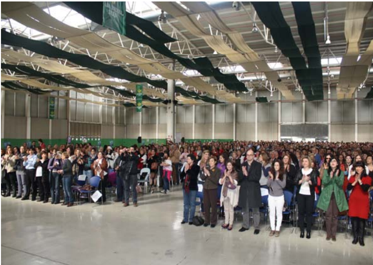
VI Encuentro de Mujeres Sindicalistas celebrado en Jaén al que asistieron centenares de mujeres de UGT Málaga.