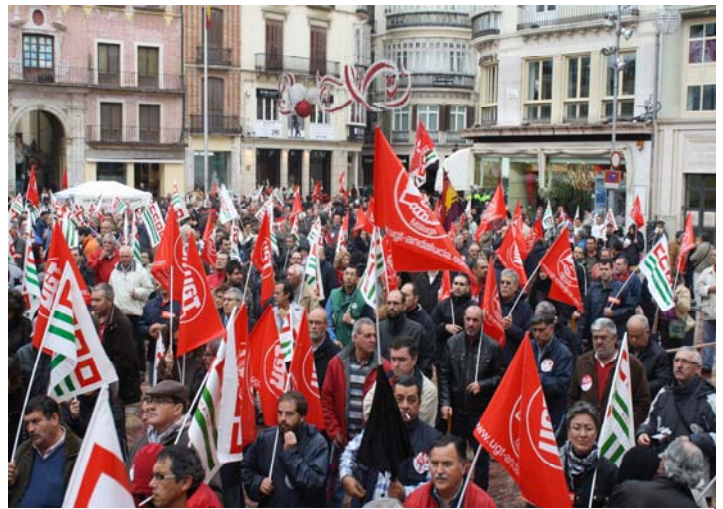
Asistentes a la manifestación convocada el pasado sábado, 18 de diciembre.

El secretario general de UGT Málaga no descartó otra huelga general si el Gobierno continúa recordando derechos laborales y sociales como empezó a hacer en mayo. Como ésta se celebraron manifestaciones en las restantes provincias andaluzas y en todo el país. en el ajuste del déficit público.