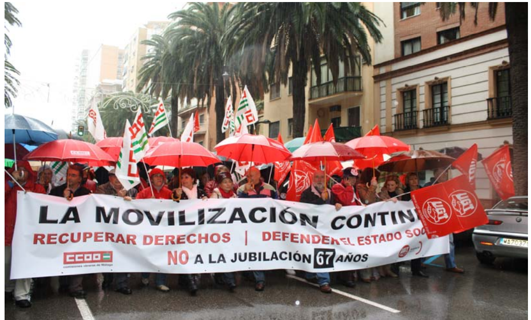
La fuerte lluvia obligó a los asistentes a abrir los paraguas durante parte del recorrido.

Pese a la intensa lluvia que cayó el pasado sábado, 18 de diciembre, ésta no hizo que amainasen los ánimos de las más de 2.000 personas que participaron en la manifestación convocada por UGT y CCOO en contra de la reforma laboral, contra el retraso de la jubilación a los 67 años así como el cambio del cómputo de años para calcular la pensión que se eleva de 15 a 20 años, y de manera progresiva, llegará a los 25. La manifestación partió a las 11.00 horas desde la Alameda de Colón, esquina con Muelle Heredia, continuó por la Alameda Principal, calle Larios hasta culminar en la plaza de la Constitución.