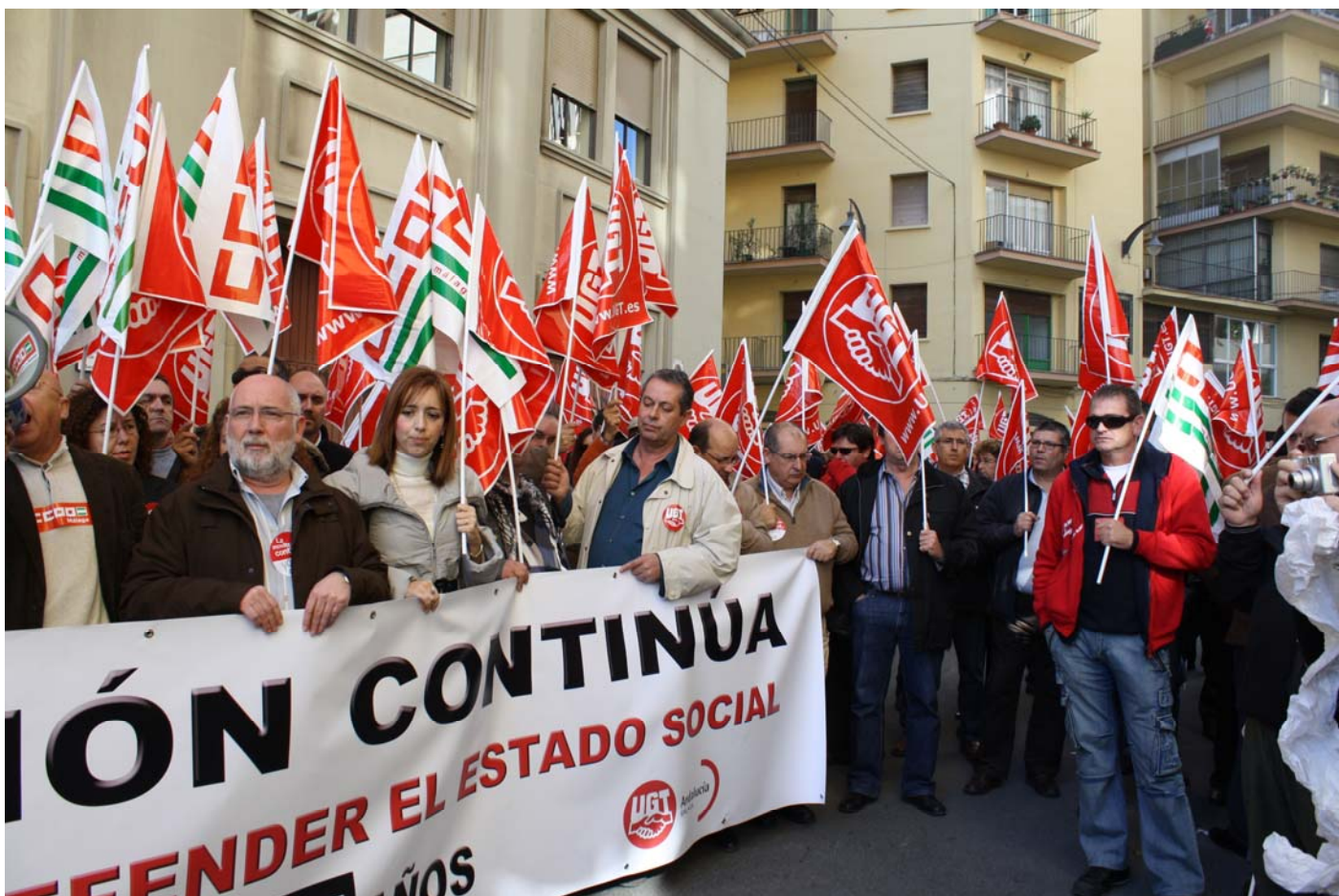
Concentración en la puerta de la Confederación de Empresarios de Málaga el pasado 15 de diciembre en contra de bloqueo de los convenios colectivos.