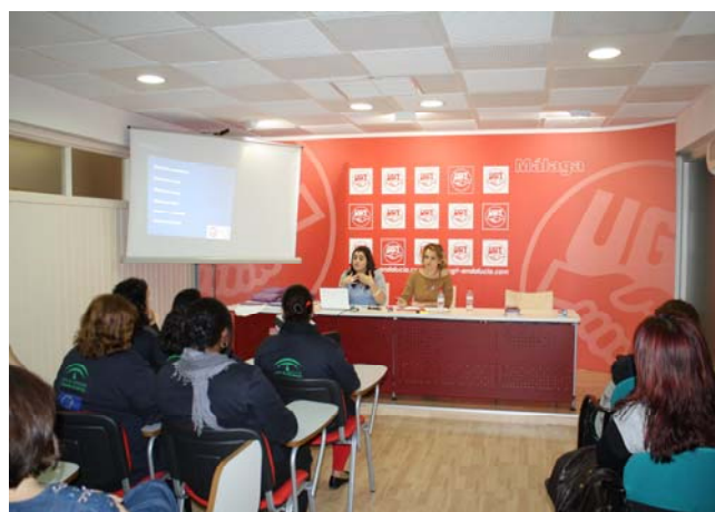
Asamblea informativa en materia de igualdad de género impartida a los alumnos del taller de empleo.

En el manifiesto que leyó una compañera de UGT también se denuncia la situación de los menores en los casos de violencia de género por su especial indefensión y vulnerabilidad, demandando que las condenas firmes por violencia de género lleven aparejada la pérdida de la custodia de los hijos/as y también la suspensión del régimen de visitas, así como la atención psicológica gratuita.