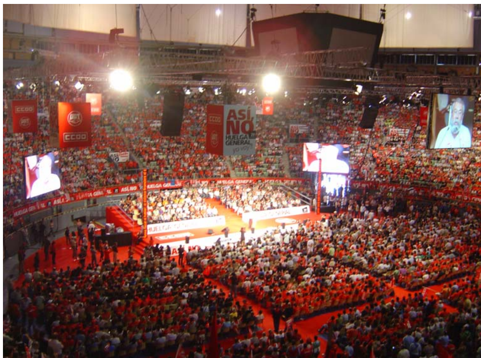
Más de 16.000 delegados asistieron a la asamblea informativa sobre la huelga celebrada en el Palacio de Vistalegre, en Madrid.

El pasado 9 de septiembre más de 150 delegados de UGT Málaga asistieron a un acto sindical previo a la huelga general del 29 de septiembre en contra de la reforma laboral del Gobierno. Fueron tres los autobuses que partieron de Málaga la noche anterior para apoyar la huelga. El acto fue presentado por la actriz Petra Martínez, y en él intervino el secretario general de la Confederación Europea de Sindicatos, John Monks, y los secretarios generales de UGT y Comisiones Obreras, Cándido Méndez e Ignacio Fernández Toxo, respectivamente. Ante más de 16.000 delegados se proyectaron dos vídeos y un videoclip con la canción de la huelga general, que interpretaron sus protagonistas en la parte final de la asamblea.