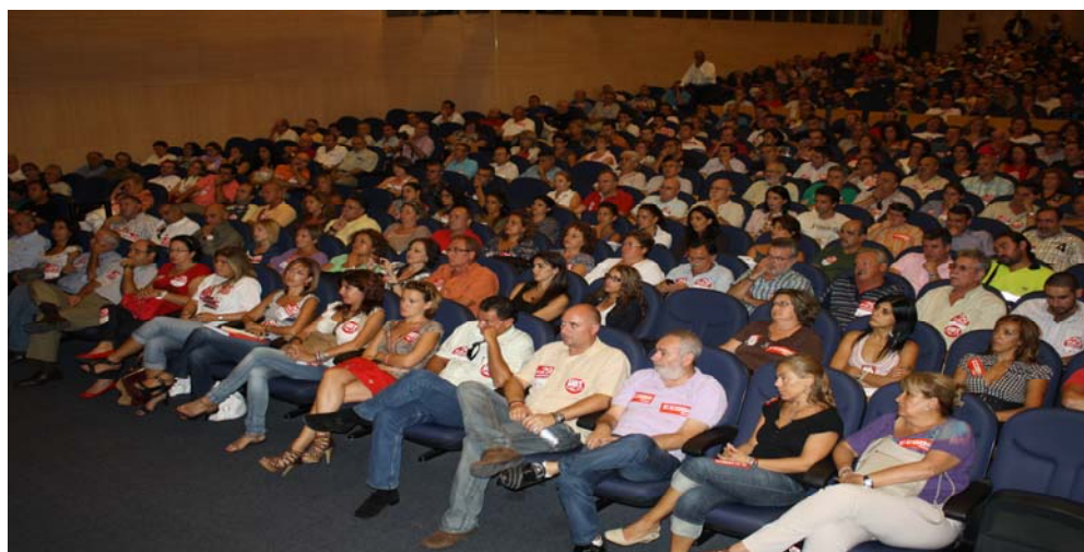
El Palacio de Congresos de Marbella acogió un acto multitudinario en el que se llenó el Salón de Actos del citado recinto con motivo de la asamblea para explicar el porqué de huelga del 29-S.