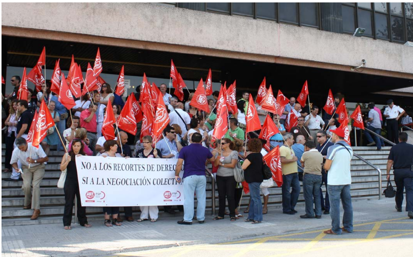
Acto central el pasado miércoles, día 15 de septiembre, frente al Edificio de Usos Múltiples y en protesta por la reordenación del sector público andaluz, llevado a cabo por la Federación de Servicios Públicos de UGT Málaga.

La Federación de Servicios Públicos de UGT Málaga llevó a cabo la pasada semana un calendario de concentraciones en contra del decreto ley aprobado por la el Consejo de Gobierno de la Junta de Andalucía el pasado 27 de julio. Estas concentraciones, que afectan a unos 4.000 trabajadores en la provincia de Málaga, entre funcionarios y personal laboral, tiene como objetivo manifestar su protesta porque este decreto: “no se ha negociado, va en contra del ordenamiento jurídico, conlleva la pérdida de empleo, recorta derechos y condiciones laborales de todos los empleados públicos, discrimina y origina conflictos entre los mismos y