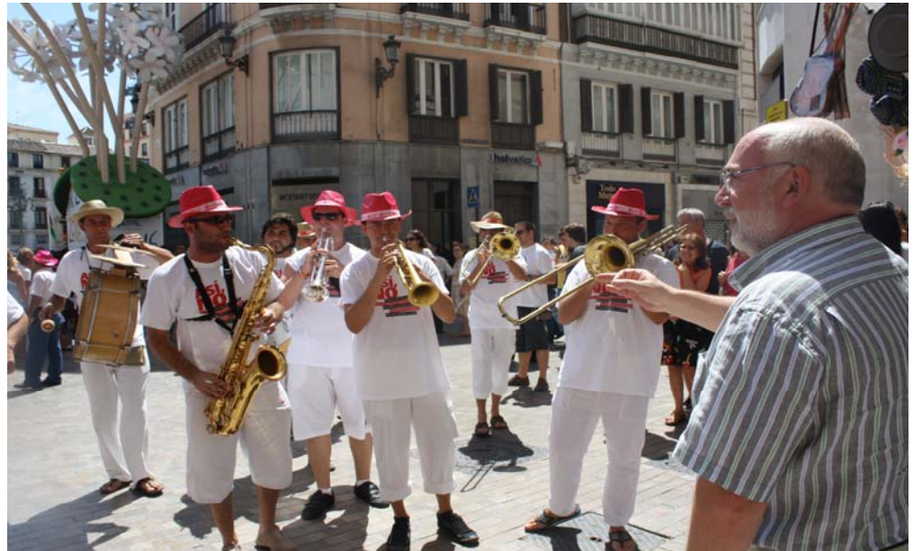
Una charanga recordando la huelga general recorrió las calles del centro histórico de Málaga durante la Feria.