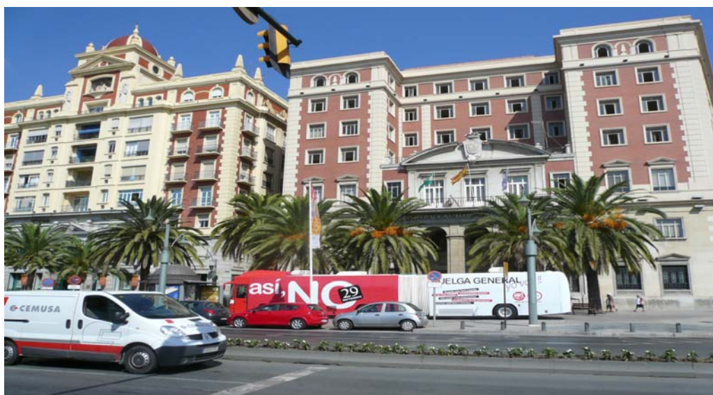
El autobús informativo de la huelga general del 29-S frente a la antigua Diputación Provincial de Málaga.