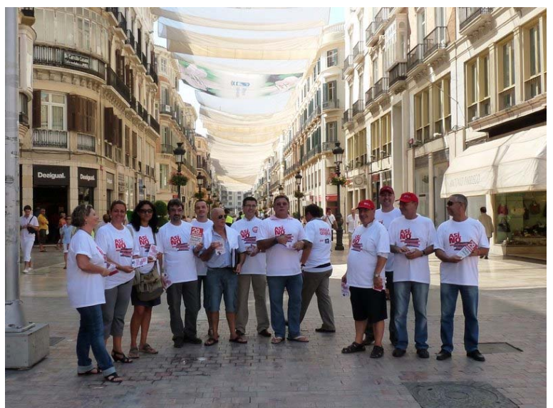
Miembros de UGT Málaga reparten octavillas en la céntrica calle Larios.