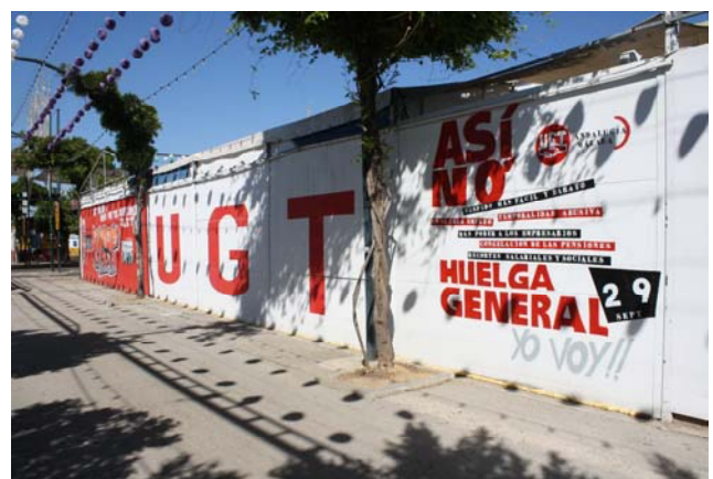
Fachada de la caseta de UGT con cartel de la huelga del 29-S.