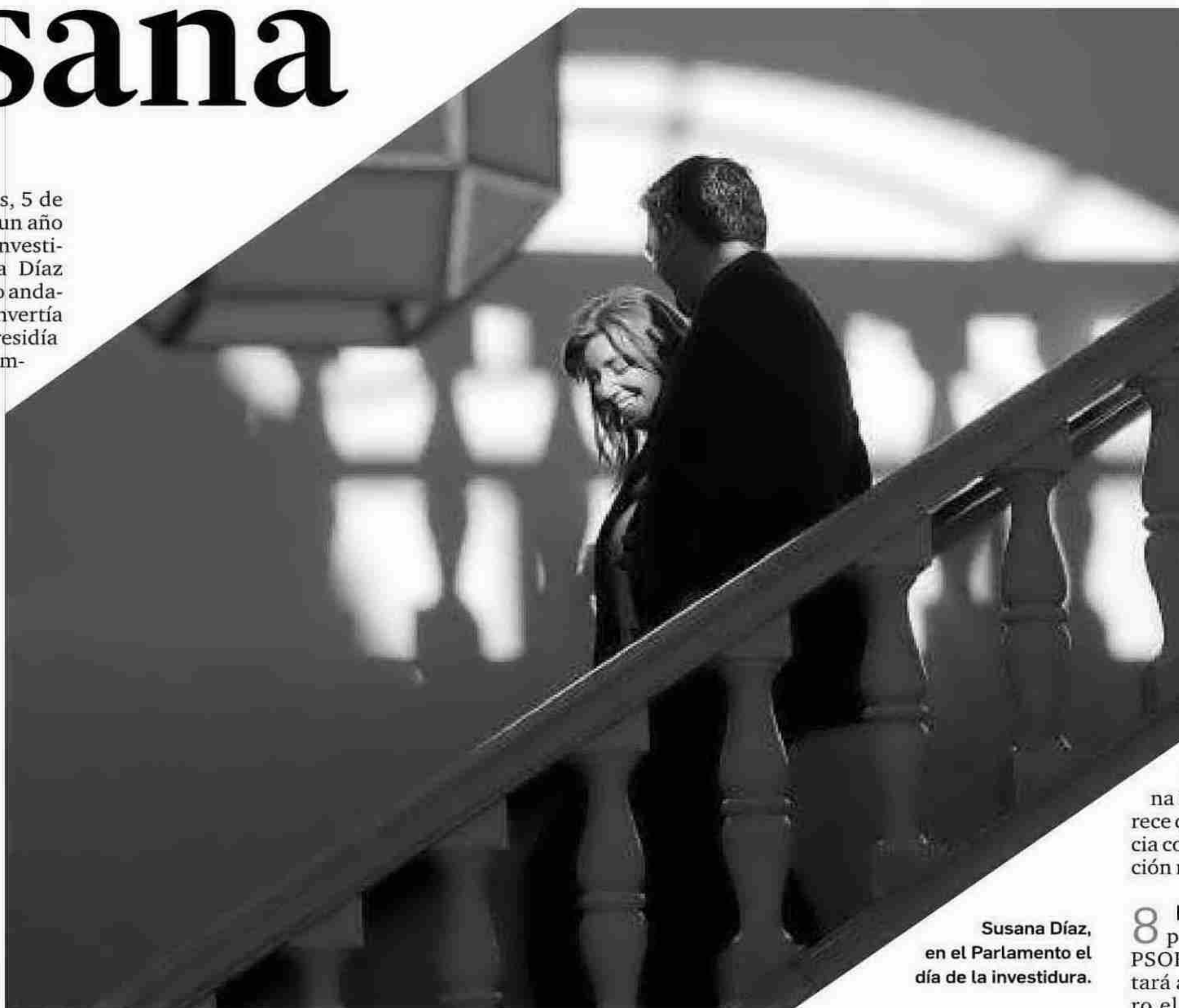
Susana Díaz, en el Parlamento el día de la investidura.

10 Y las inversiones. Susana Díaz seguirá este año firmando convenios con las grandes compañías españolas, aunque hay fondos de inversión internacionales que están interesados en abrir canales en Andalucía. Uno de ellos se ha retrasado por conflictos bélicos de este verano.