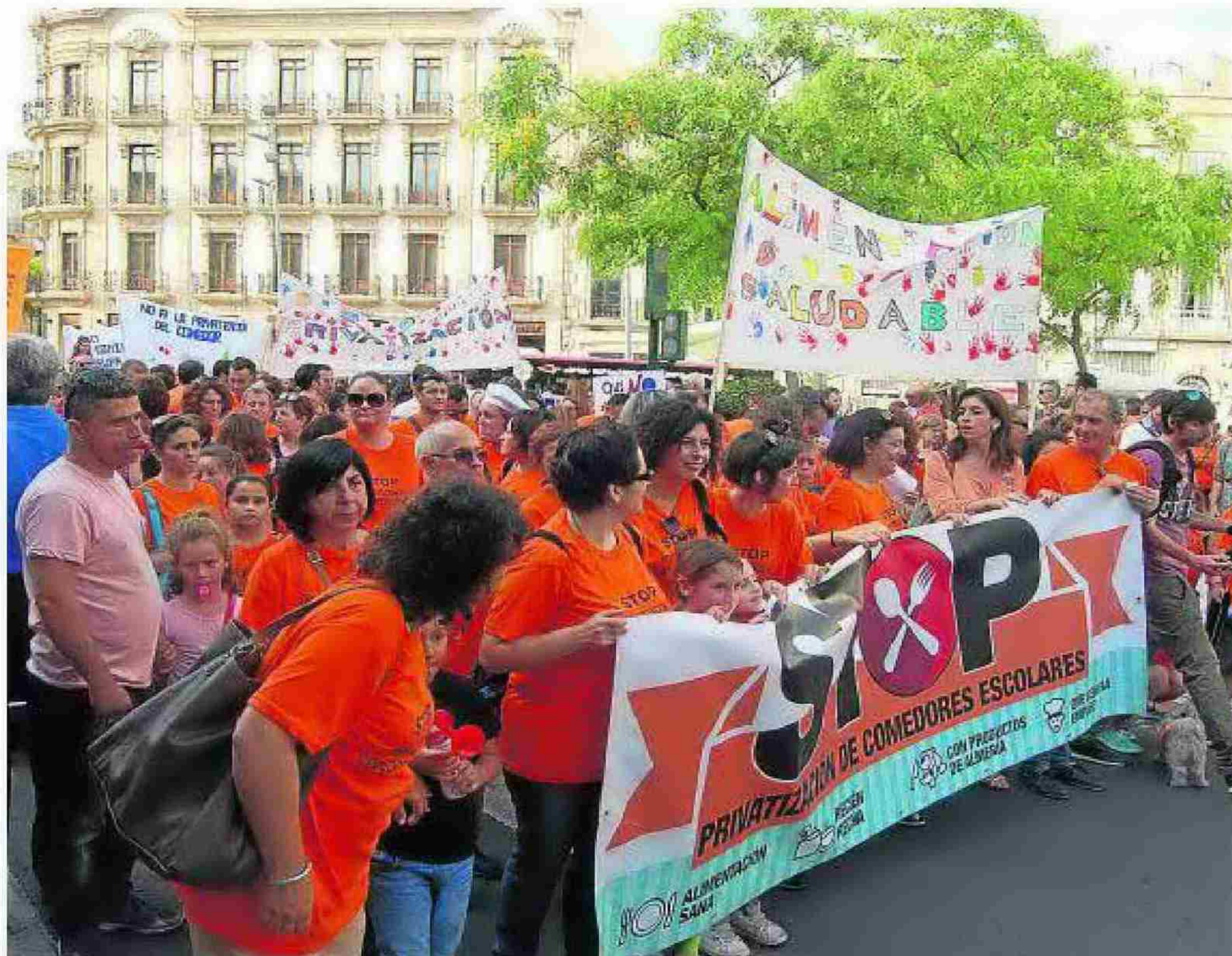
Una de las movilizaciones de las AMPA para seguir gestionando los comedores escolares.

En cualquier caso, los padres y madres han mostrado su «alivio» al conocer que los siete centros –un instituto y seis colegios– que durante