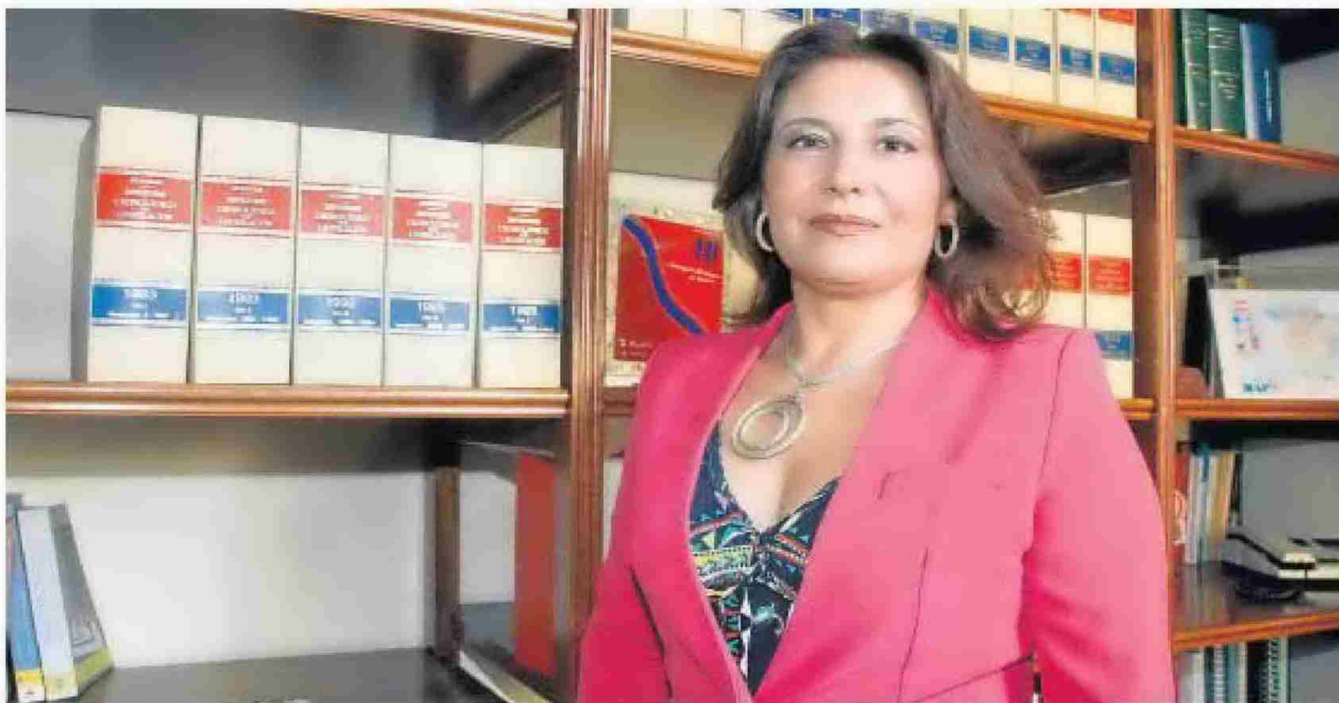
La delegada del Gobierno de Andalucía en una de las dependencias de la Subdelegación del Gobierno de Almería.