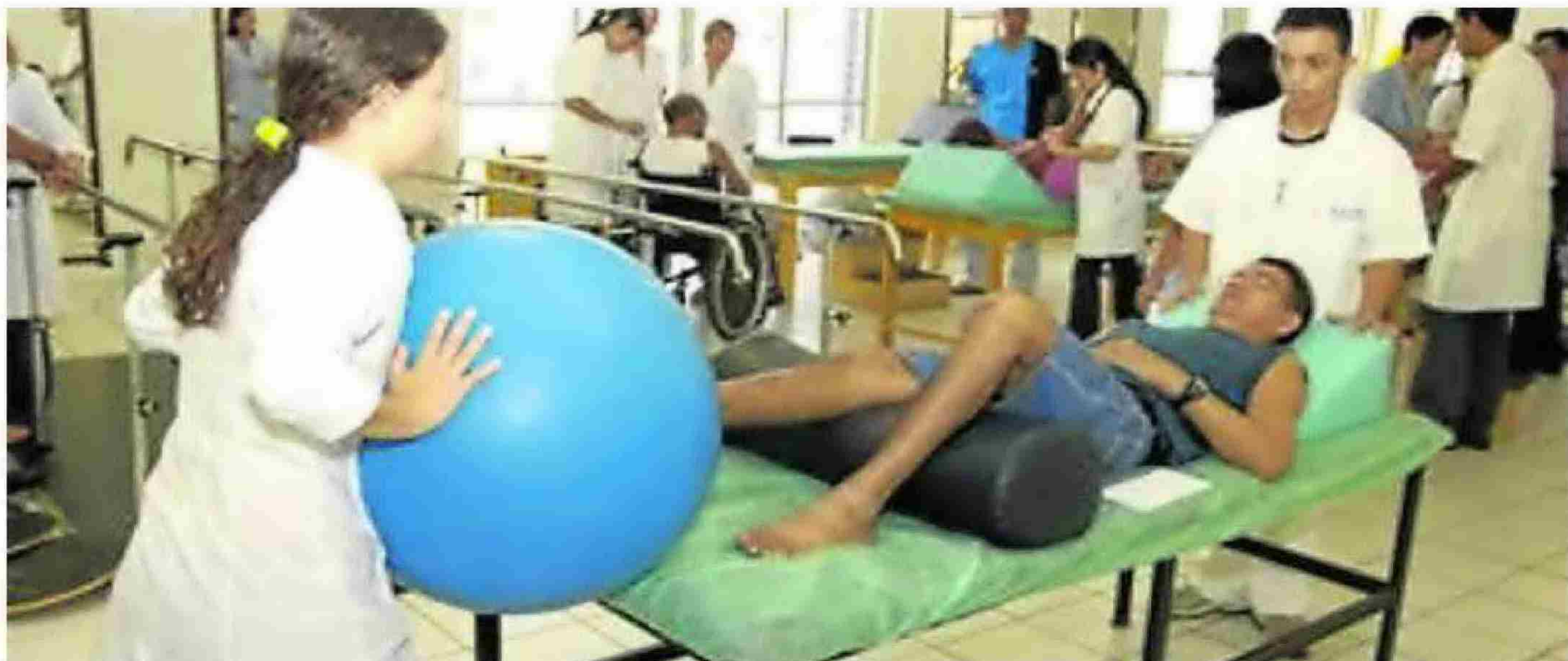
Alumnos de Fisioterapia practicando en clase las técnicas aprendidas para ejercer profesionalmente su trabajo una vez terminen la carrera. :: IDEAL

En Andalucía las carreras más demandadas han sido Medicina, Enfermería y Educación Primaria con notas inferiores a la de Fisioterapia