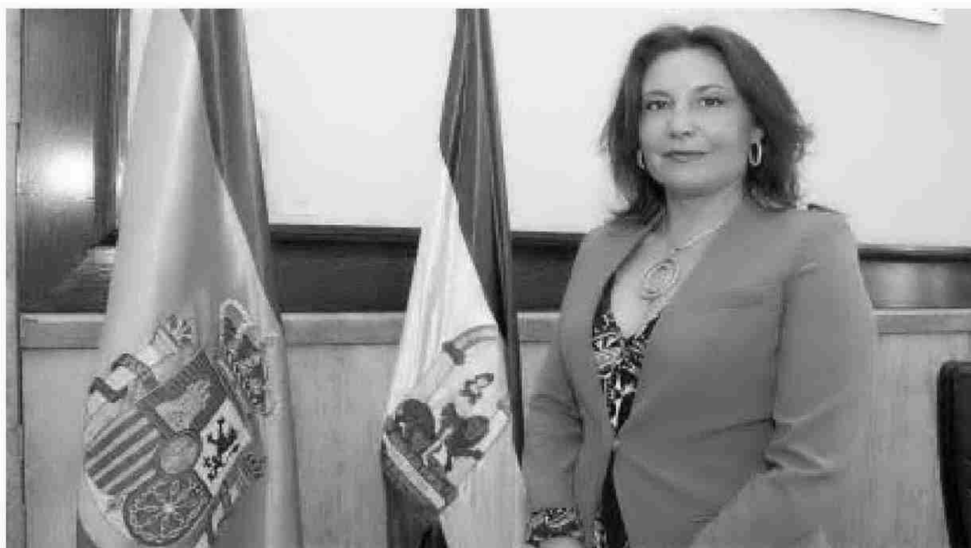
La delegada del Gobierno de Andalucía en uno de los despachos de la Subdelegación del Gobierno en Almería.

— La Delegación tiene una actividad principal, que para mí ha sido la más complicada, relativa a la seguridad. En Andalucía es muy importante por la enorme extensión del territorio y porque es una comunidad muy poblada. Tuve que trabajar con mucha cautela al principio e incluso pedir asesoramiento a los delegados anteriores porque es un tema muy delicado de llevar. Al final como conclusión de esta nueva experiencia puedo decir que se ha bajado la criminalidad en Andalucía a mayor ritmo que a nivel nacional, con casi un 50% de casos resueltos, y esto evidencia que se ha llevado a cabo una buena ges-