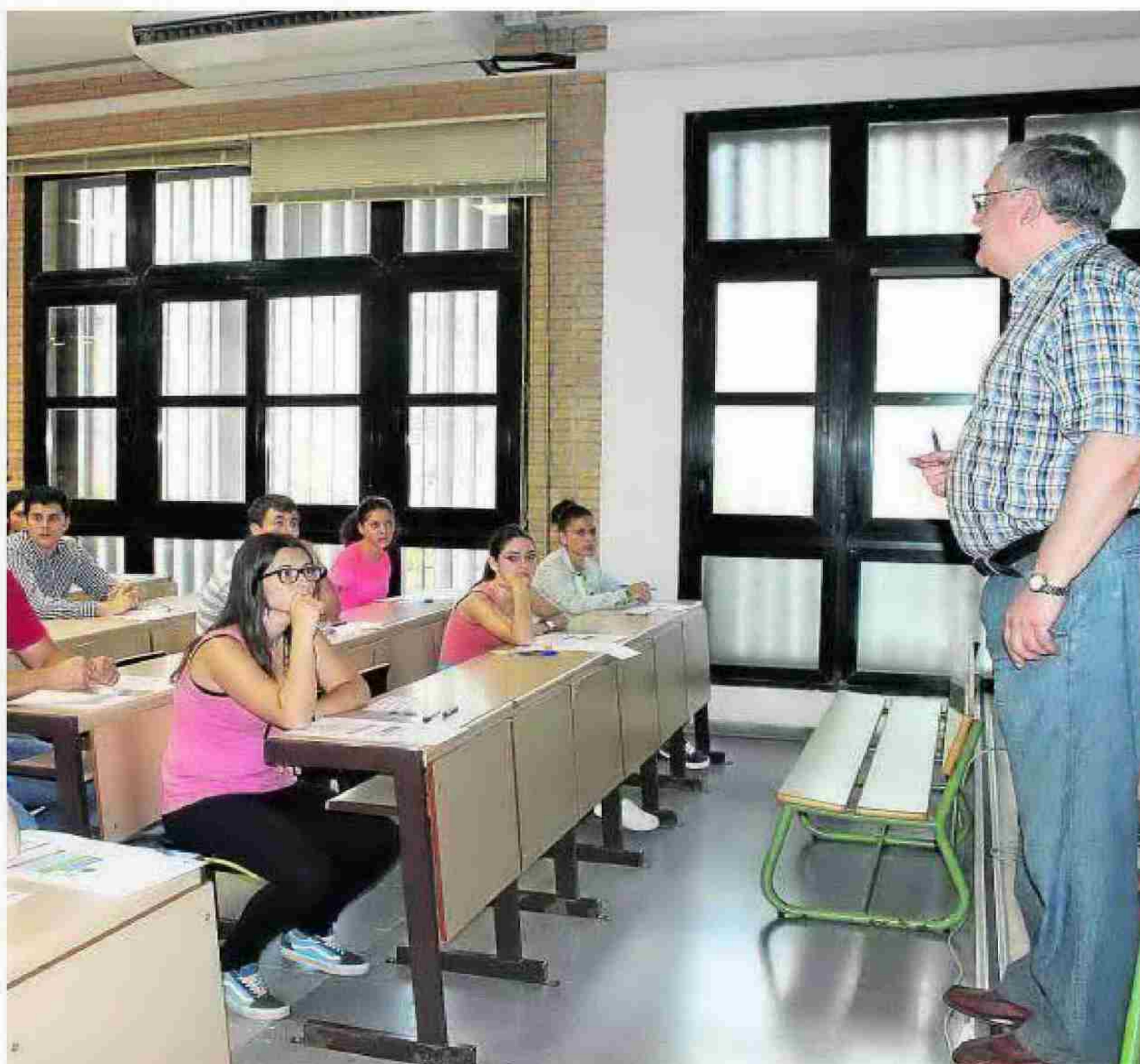
La Junta de Personal apunta a las diferencias entre centros y a la superación de las ratios en algunos. :: IDEAL

Por último, a juicio de este órgano reunido en sesión plenaria el pasado miércoles 23 de octubre, existen otras muchas razones que vaticinan un curso bastante negativo, tales como el deterioro generalizado y mantenido en el tiempo de las condiciones laborales de los trabajadores de la enseñanza, la falta de contratación de personal de administración y servicios, y personal educativo complementario no docente, el endurecimiento de los requisitos para el acceso a las becas y la falta de oferta en enseñanzas no