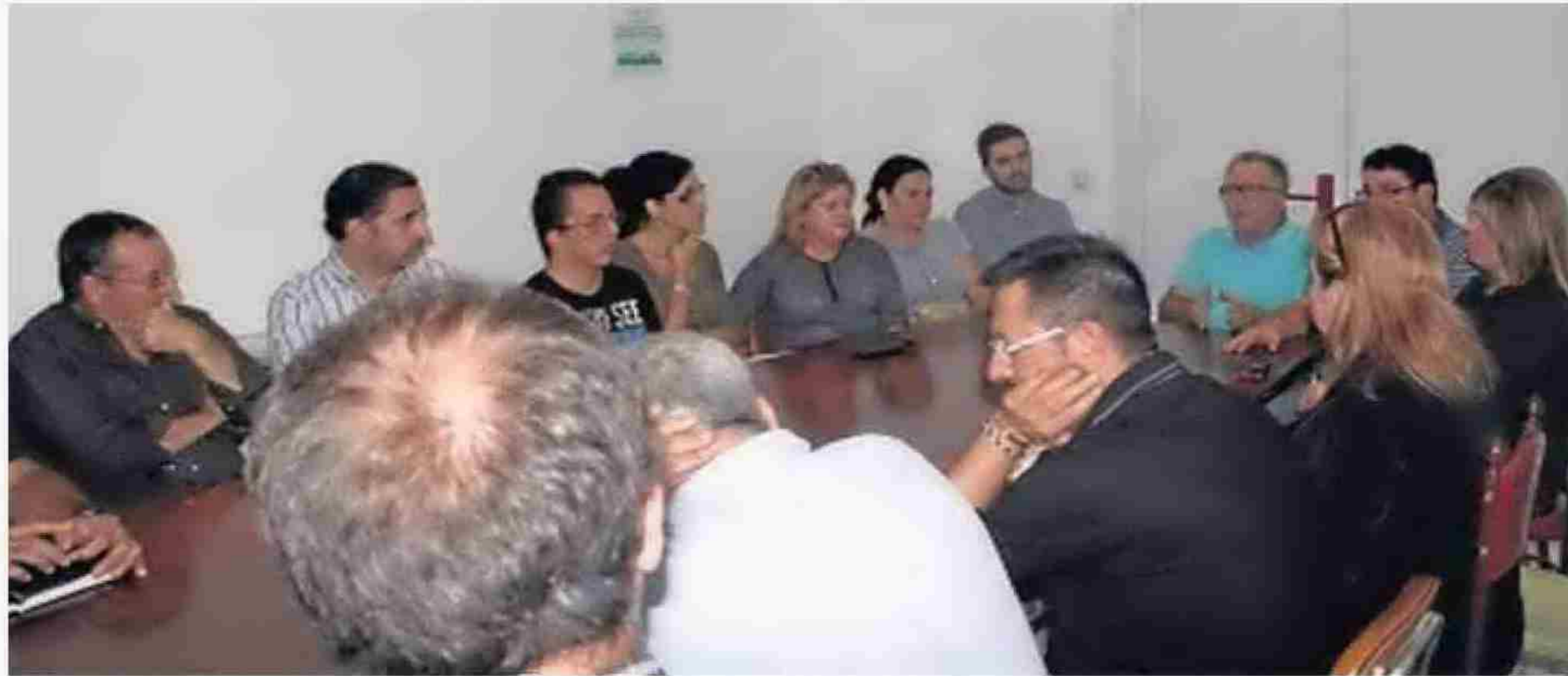
REUNIÓN de centrales sindicales y partidos de izquierda en Macael para pedir alternativas laborales al mármol.

Particularidades Para establecer posiciones, los sindicatos CCOO y UGT se reunían a finales de esta pasada semana con representantes de Izquierda Unida y PSOE. Y para empezar una puesta en común y es que, según las cuatro organizaciones, la alta tasa de desempleo en la Comarca del Mármol, por su especial dependencia del sector de la piedra natural, y la ausencia de alternativas, "se hace necesario el esfuerzo y compromiso de las dis-