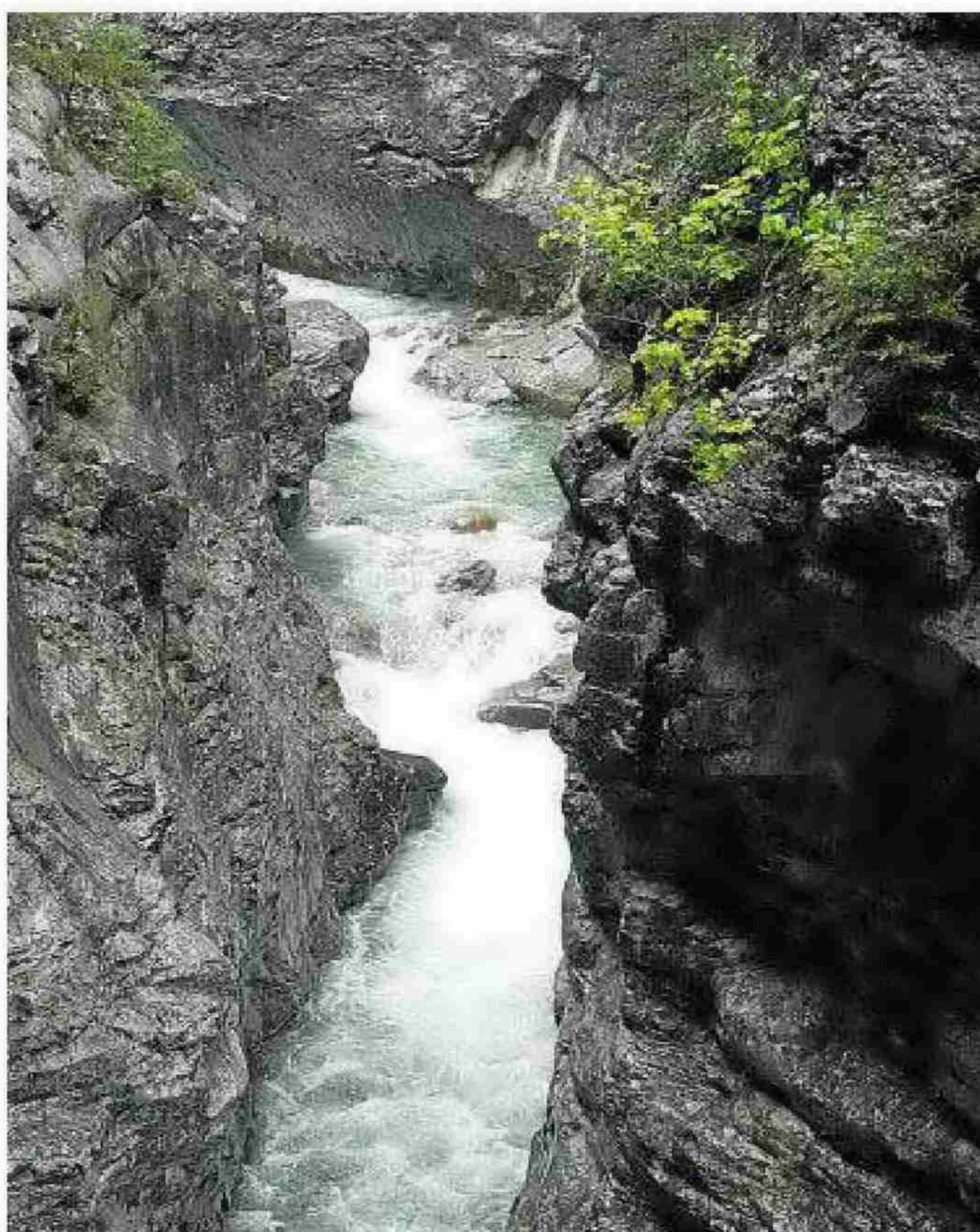
La gestión sostenible del agua, entre los contenidos del curso. :: IDEAL

Puntualizan además que uno de los principales problemas con los que cuentan los consistorios es la falta de personal técnico con la formación adecuada, lo que lleva a la contratación externa para desarrollar determinados proyectos. Aunque se desarrollen con solvencia,