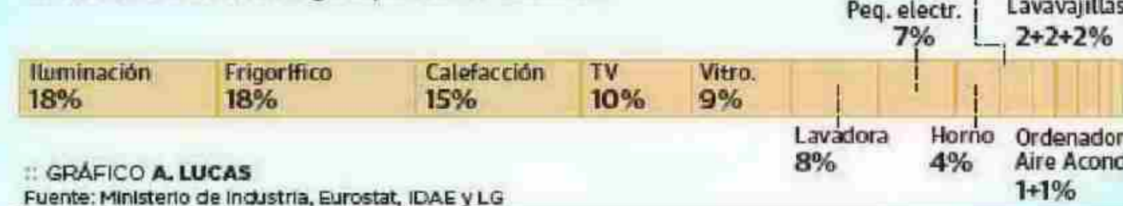
GRÁFICO A. LUCAS Fuente: Ministerio de Industria, Eurostat, IDAE y LG

El consumo medio en un hogar español es de 4.000 kWh