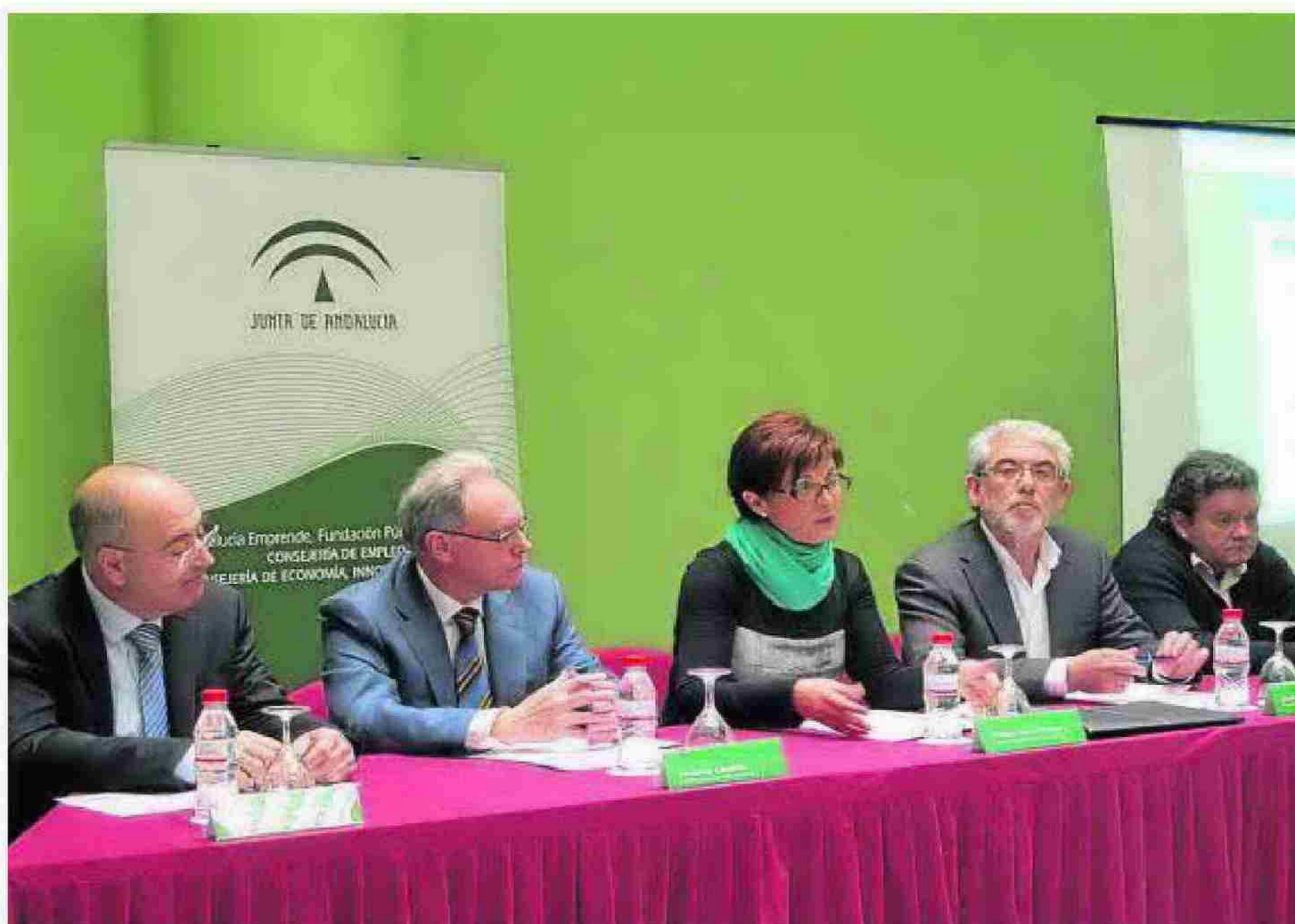
Representantes de Andalucía Emprende, Asempal, la Junta y los sindicatos. :: IDEAL