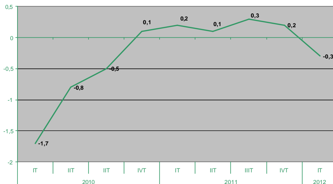
Evolución trimestral del PIB (interanuales)

De esta forma, tras cinco trimestres con tasas de crecimiento positivas, aunque muy reducidas y claramente insuficientes para lograr generar empleo, volvemos ahora a la senda de decrecimiento en la que ya estuvimos la mayor parte de 2010.